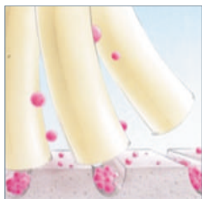
Klasiskā šķiedra (piem. kokvilnas)